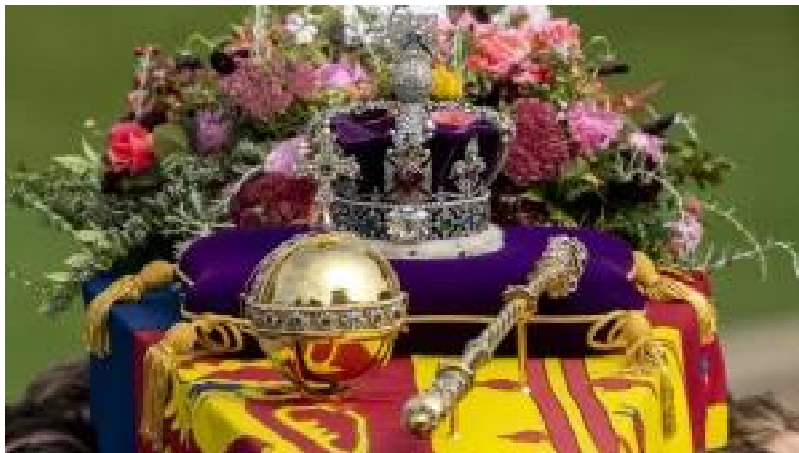
Kronjuwelen auf dem Sarg der Queen