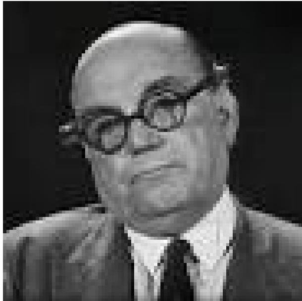
Sefton Delmer

Als Auslandskorrespondent der konservativen Londoner Tageszeitung „Daily Express“ berichtete Delmer seit 1928 mehrere Jahrzehnte lang vor allem aus und über Deutschland.