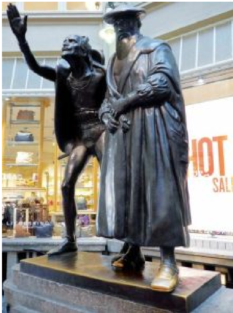
Mephisto und Faust Leipzig