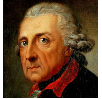
Friedrich der Große

Mit dieser Rede ist John F. Kennedy auf einer Linie mit Friedrich II. , König von Preußen, der ebenso freiheitlich selbstlos forderte: