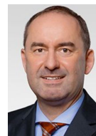
Hubert Aiwanger

Gerade mal zwei Wochen nach der bayerischen Landtagswahl vom 8. Oktober 2023 haben sie ihren Koalitionsvertrag CSU-Freie Wähler abgeschlossen und ihren gemein-samen Verrat an unserem deutschen Volk festgeschrieben: Die totale Unterwerfung unter israelisches Diktat. So heißt es in dem Vertrag: