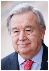
Antonio Guterres (Startpa ge)

Denn du bist ein heiliges Volk dem HERRN, deinem Gott. Dich hat der HERR, dein Gott, erwählt zum Volk des Eigentums aus allen Völkern, die auf Erden sind.