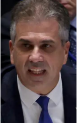
Israels Außen- minister Cohen (Compact )

Diese Wahrheit läßt der Staat der Auserwählten keine Sekunde gelten. Außenminister Cohen erhob sofort Einspruch und forderte den Rücktritt des UN-Generalsekretärs!