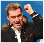
Markus Söder

Hubert Aiwanger , Chef der „Freie Wähler“ von Bayern, sowie Markus Söder , Ministerpräsident (CSU) von Bayern, sind sich in ihrer Gleich-gültigkeit gegenüber Deutschland einig.