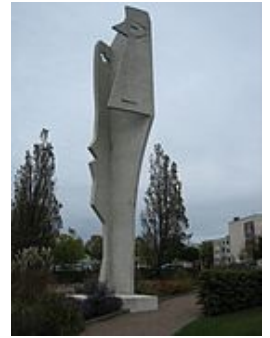
Picasso, Frauenkopf Halmstad/Schweden

erklärte Huelsenbeck. In Rußland war da die bolschewistische Revolution bereits ausgebrochen. Vielleicht waren die Dadaisten deshalb so fröhlich, denn der Bolschewismus sollte auf ganz Europa übergreifen und vollenden, was durch den ersten Weltkrieg begonnen war: die gesamte bisherige europäische Kultur hinwegfegen.