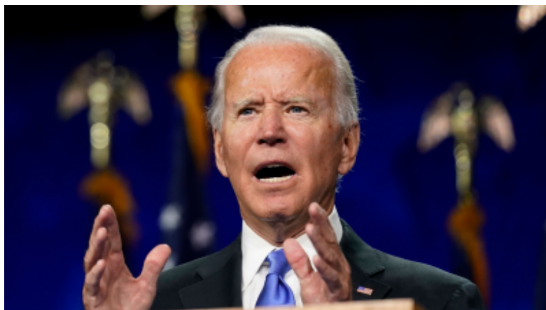
Joe Biden

Nur weiter so, Mr. Biden! Mit dem Stolz der Menschen rechnet ihr nicht: