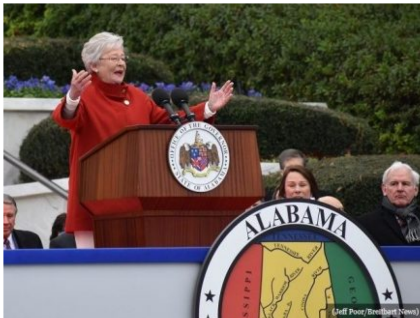
Governor of Alabama Kay Ivey

„Das Letzte, das Letzte, was wir brauchen, ist der Neandertaler, der denkt, daß in der Zwischenzeit alles in Ordnung ist, nehmen Sie Ihre Maske ab, vergessen Sie es“, sagte Biden über Abbotts und Reeves Bewegungen.