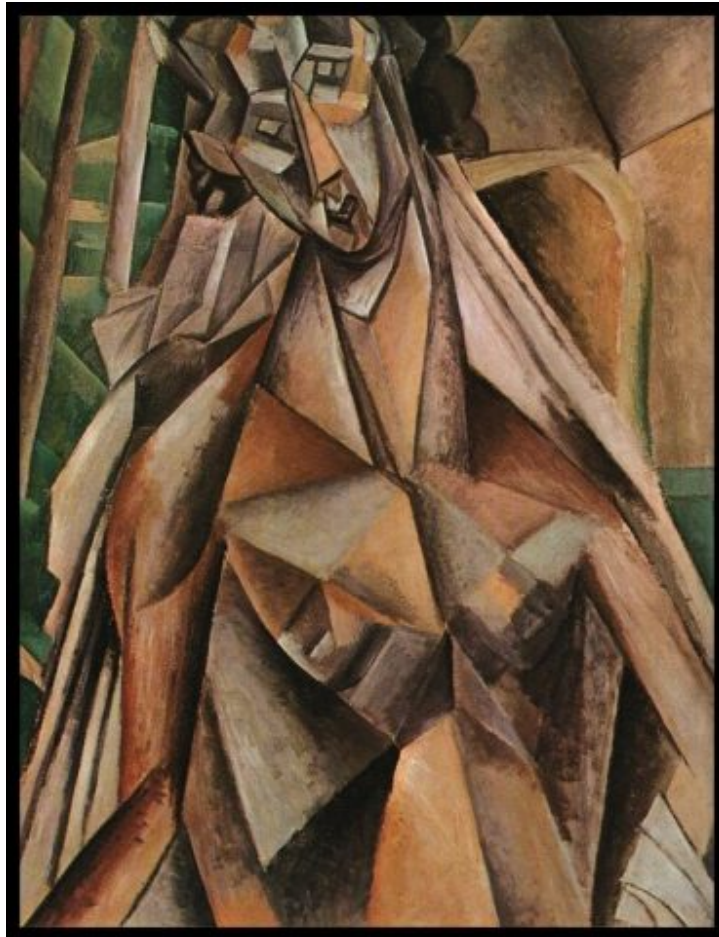
Picasso, „Sitzende Frau“

Diese politisch unkorrekte Ansicht und die Art sowie die Themen seiner eigenen Kunst ließen ihn in der Zeit der Weimarer Republik mit den unerhörten „Reparations“-Forderungen der „Siegermächte“, vor allem Frankreichs, im Abseits stehen und wirtschaftlich in tiefe Armut fallen, so daß er sich gezwungen sah, nach Italien auszuwandern, wo er Asyl und Schutz gewährt bekam bei einer Deutschen, die mit einem