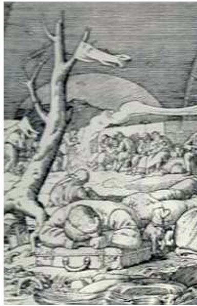
Friedrich Kollet, Das Elend der deutschen Ost- Vertriebenen (Bild- Auszug)

Kollet zeigt in seiner Kunst das Ergebnis, das, was in der „Höhle“ angerichtet war.