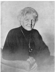
Dr. Mathilde Ludendorff

Völkern erwacht, daß nur das Menschlicher-Werden der Menschen die Zerstörung ihrer selbst und ihrer Welt, das völlige Sinnlos-Werden der gesamten Lebensgeschichte der Erde verhindern kann.*