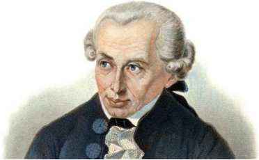
Immanuel Kant (1724 - 1804)

die Natur mit ihrer Gesetzlichkeit in Raum, Zeit und Ursächlichkeit betrifft, als auch, was die überbe-wußte Schau, die „In-Sicht“ zu erkennen vermag: das Wesen, das frei von Raum, Zeit und Ursächlichkeit das Weltall durchwaltet, das Göttliche.