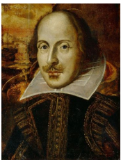
William Shakespeare

Es gibt Dinge zwischen Himmel und Erde, Horatio, von denen sich eure Schulweisheit nichts träumen läßt.